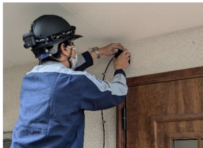
電源や美観に配慮した設置

屋外に IP カメラを設置する場合、電源や通信環境の確保、美観を意識した配線など様々な課題があります。イツコムは、通信サービスを提供するとともに、設置工事やアフターサポートの高い技術力を有しており、電源や美観に配慮した屋外への IP カメラ設置が可能です。